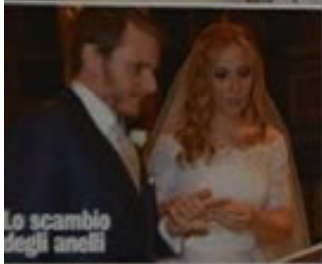
Lo scambio degli anelli