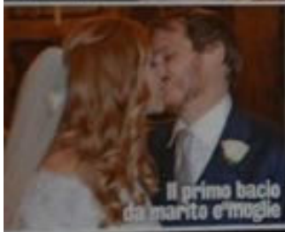
Il primo bacio da marito e moglie