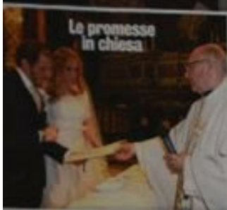
Le promesse in chiesa